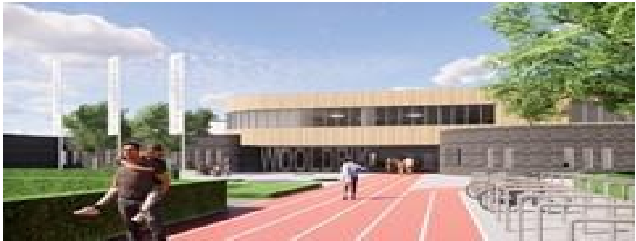
Art Impression nieuwbouw 't Wooldrik

worden uitgevoerd en passen binnen het hiervoor gestelde kader, hebben de waardering en kunnen rekenen op de steun van D66.